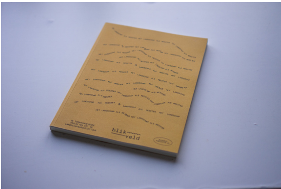
enkele beelden van onze publicatie