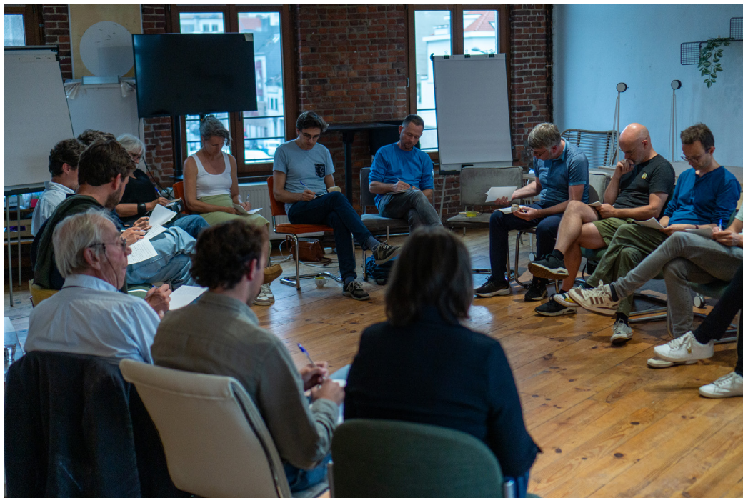
een onmogelijk gesprek over onze gedeelde waarden.