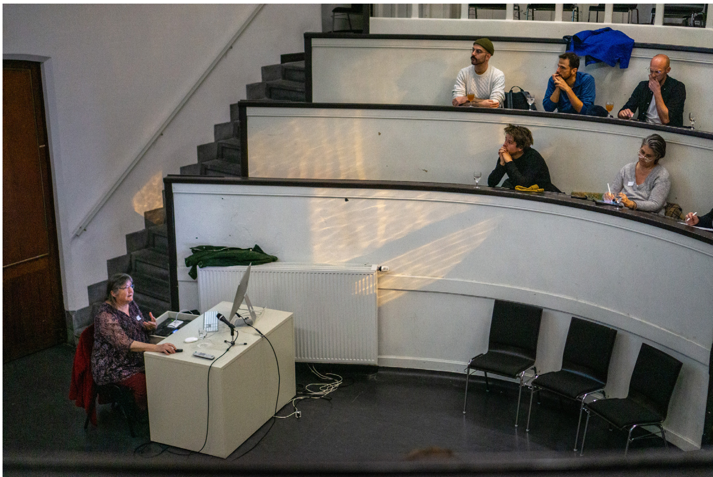
een toekomstatelier over het vademecum natuurtechnieken (i.s.m. AWV)